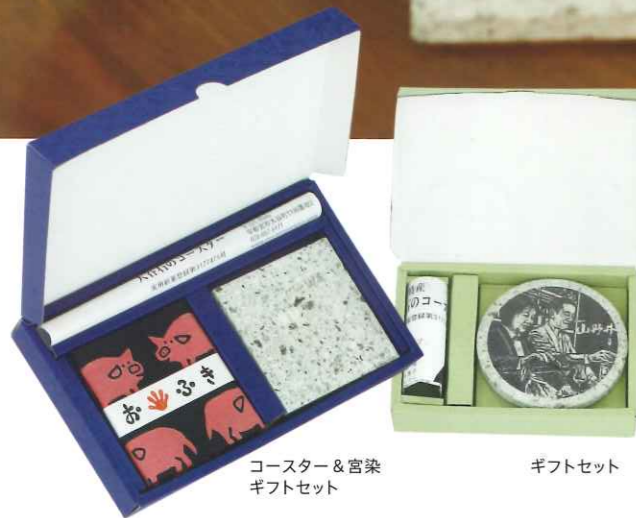
コースター&宮染 ギフトセット