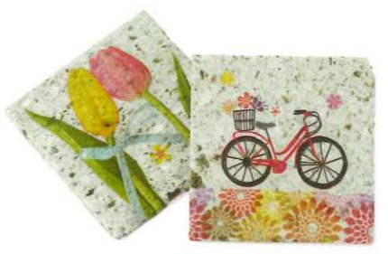
01 デコパージュ 切り抜いた紙を貼付ます。(体験時間:約30分)