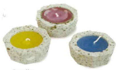
Candle キャンドルとしての使用後は小物入れに