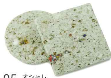
04 石貼 色々な大きさの大谷石を貼り付けます。(時間:約60分)