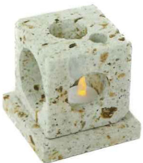
Table light キャンドルやLED照明などを入れてやわらかな光が空間演出 ※LEDランプは商品に含まれません