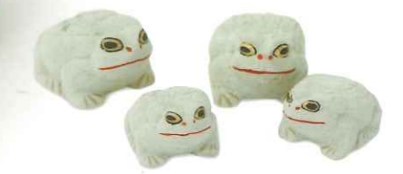
Frog ornament 手のひらサイズのカエル。無事に帰ることを願って玄関に。

鉢や一輪挿しの受け皿として使うと、石とガラス、石と陶器などの異素材感が相俟って個性的でやわらかな空間をつくれます。暮らしの中の粋な天然素材。