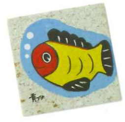
02 石絵 大谷石に水彩絵の具で描きます。(時間:約60分)