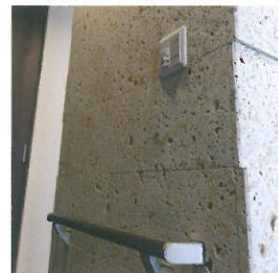
玄関仕切り壁（背面）