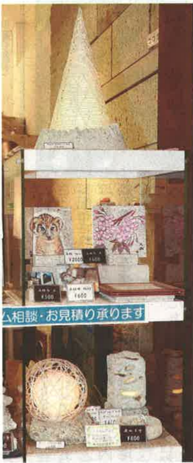
若者にも人気の大谷石を使った小物(「@おおや」で)